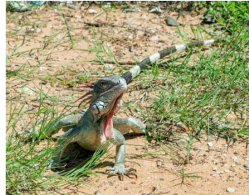
Deze leguaan is vrijer dan wij, de Meesters der aarde ...

HET IDEAAL van Wereld-Federalisme klopt dus weer aan de deur. Juist! Mee eens. Maar niet zonder een echt democratische politieke en economische wereldorde (die wij de 'Rechte Derde Weg' noemen). En voorts niet zonder verzoening tussen alle religies. En, tenslotte, ook niet onder één enkele Wereldregering.